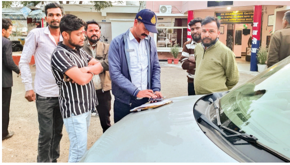
हरिभूमि न्यूज ▶ कुरावर

नगर में एंजल्स एवं केडीपीएस निजी विद्यालयों द्वारा आयोजित फेयरवेल कार्यक्रमों के दौरान यातायात नियमों की खुलेआम अनदेखी करना छात्रों एवं वाहन चालकों को महंगा पड़ गया। मामला जिला प्रशासन के संज्ञान में आते ही यातायात पुलिस ने कुरावर पहुंचकर सख्त कार्रवाई की और फेयरवेल जुलूस में शामिल वाहनों पर चालानी कार्रवाई की।