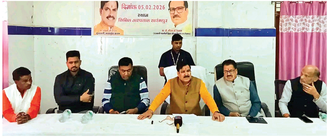
हरिभूमि न्यूज ▶ सारंगपुर