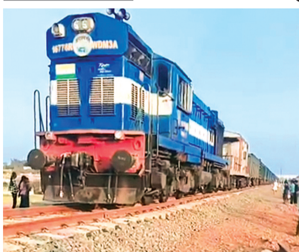
हरिभूमि न्यूज ▶ राजगढ़

बीते करीब 30 सालों से राजगढ़ नगर में रेल आने का इंतजार कर रहे रहवासी शुक्रवार को खासे उत्साहित नजर आए। दरअसल