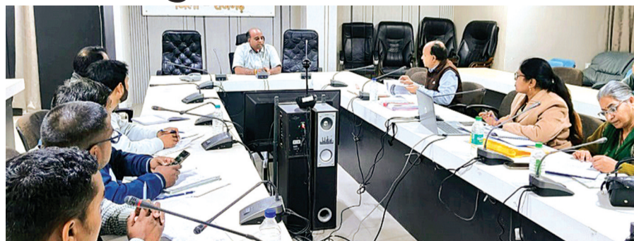
हरिभूमि न्यूज ▶ राजगढ़

विभिन्न विभागों के तहत चल रही योजनाओं के संबंध में कलेक्टर डॉ. गिरीश मिश्रा द्वारा लगातार समीक्षा बैठकें आयोजित की जा रही हैं। इन बैठकों में लक्ष्यों के विरुद्ध कमतर प्रगति पाए जाने पर जिम्मेदारों की वेतनवृद्धि रोकने, शोकाज नोटिस सहित अन्य तलख कार्यवाहियां भी की जा रही हैं।